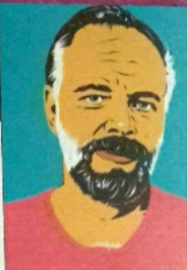
PHILIP K. DICK (1928-1982)

Prolífico escritor estadounidense de novelas de ciencia ficción. Muchas de ellas fueron adaptadas al cine, como Blade Runner .