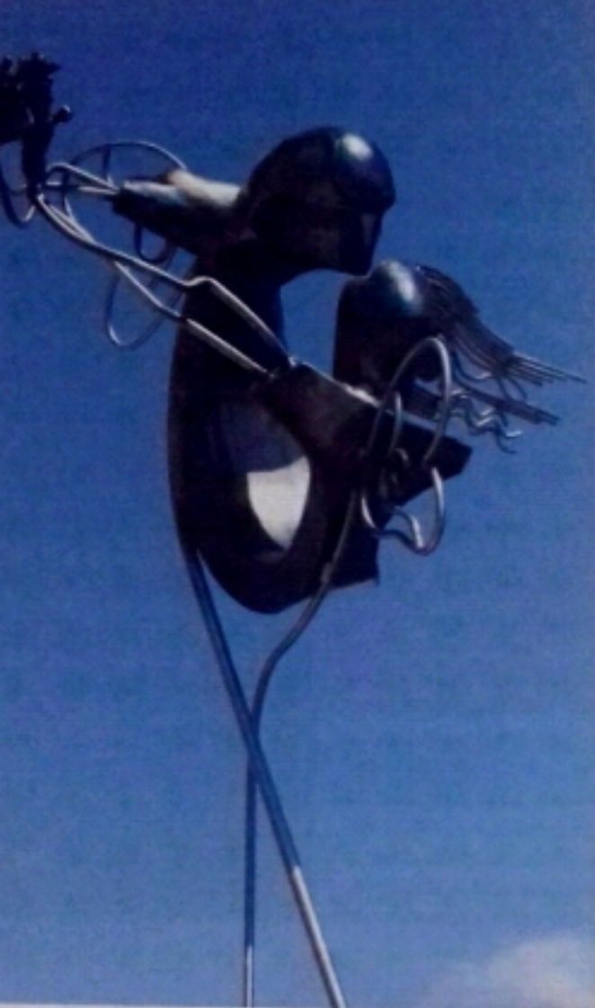
Guillermo Lotz, Los amantes mariposa, escultura en hierro.